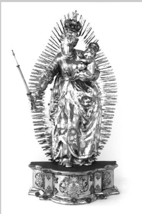
Joseph Müller, Statue en argent , 1790 Basilique Notre-Dame, Fribourg